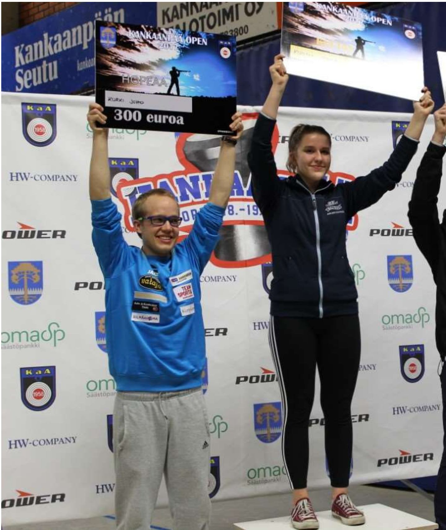
Superfinaalin palkintojen jako.